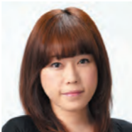
さゆりん 【担当番組】 CHOICE

丑年、私、歳男であります。還暦を迎えます。 2020年になっても円熟とか老練などとは無縁の私ではありますが、この際、いぶし銀ではなく燦然と金色に輝くような一年にしたいと考えています。私を見るときはサングラスを忘れずに!