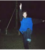
sooogood! 12月9日には新作「Strawberry,Gun,St.Bernard」をリリース