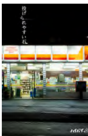
Thank You sold out ハイバイ 「投げられやすい石」 12/5(土)・12/6(日)

会場/三重県文化会館・大ホール 開場/10:30 開演/11:30 席種・料金(税込)/全席指定 500円(前売り) ◎ 三重県文化会館チケットカウンター TEL.059-233-1122