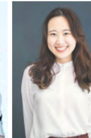
井田玲音名(SKE48)